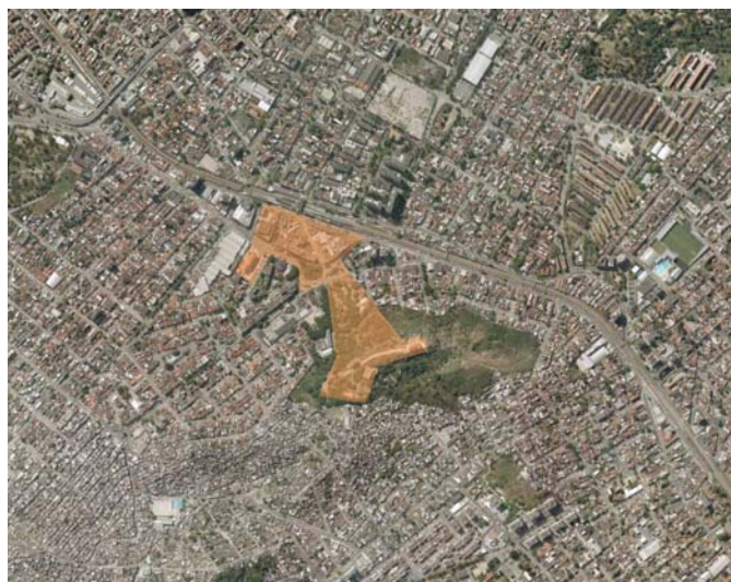
Figura 1: Área da Festa da Penha

A motivação original da existência da Festa da Penha é religiosa. Embora tenha tido o sentido ampliado ainda em seus primórdios, tudo começou devido às peregrinações à antiga ermida localizada no alto da colina, onde hoje reside o santuário. As romarias ao local ocorrem desde 1713, quando peregrinos sobem os 365 degraus abertos na pedra que levam à igreja, a fim de agradecer as graças alcançadas ou rogar por seus entes queridos e participar das festividades. i A Igreja da Penha, localizada sobre a rocha na altura 69 metros, é forte referência na cidade, dominando a paisagem quando vista a grandes distâncias por quem está na zona norte da cidade (fig. 02).